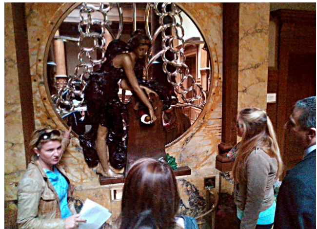
Wizyta studyjna w Willi Frankla w Prudniku.

Wizyty studyjne wykorzystano również do przetestowania karty ewidencyjnej, która jest jednym z produktów projektu. Jak się okazało karta wymaga jeszcze kilku kosmetycznych zmian wynikających z różnic językowych w krajach projektu. Nie zawsze znaleźć można w języku angielskim nazwę techniki lub technologii występującej w danym kraju. W związku z tym do powstającej bazy danych dołączony zostanie słownik wyrażeń, który w ułatwi zakładanie nowych kart jak i komunikację między uczestnikami projektu.